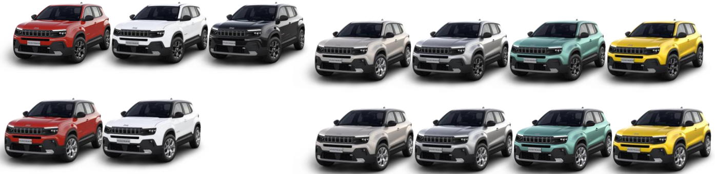
Obrázky sú ilustračné