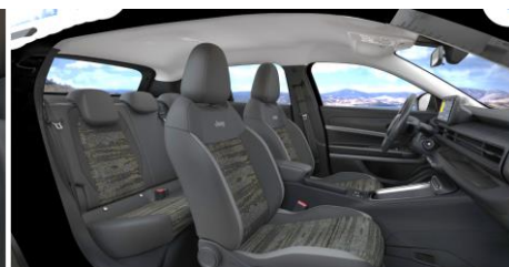
Obrázky sú ilustračné